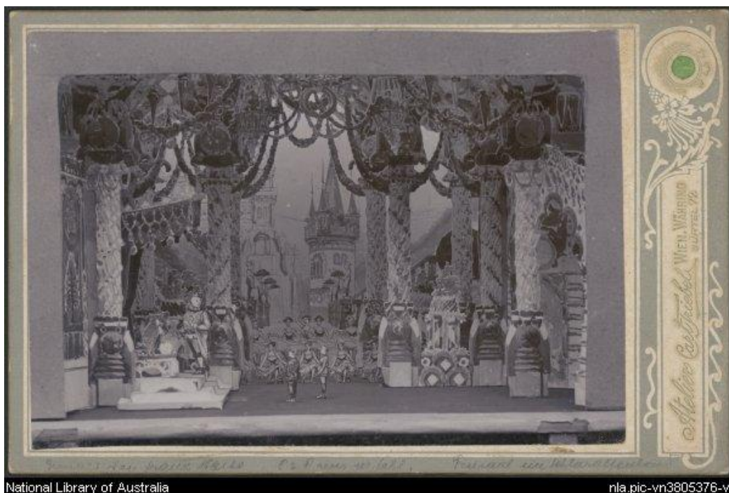
Bilder von der Uraufführung